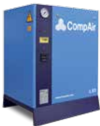
Kompressor auf Grundrahmen