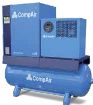
Vollständige Airstation mit Kompressor, Trockner und Druckluftbehälter