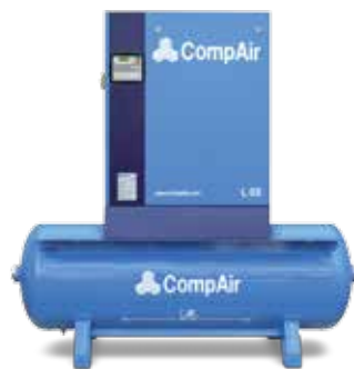
Kompressor auf Druckluftbehälter